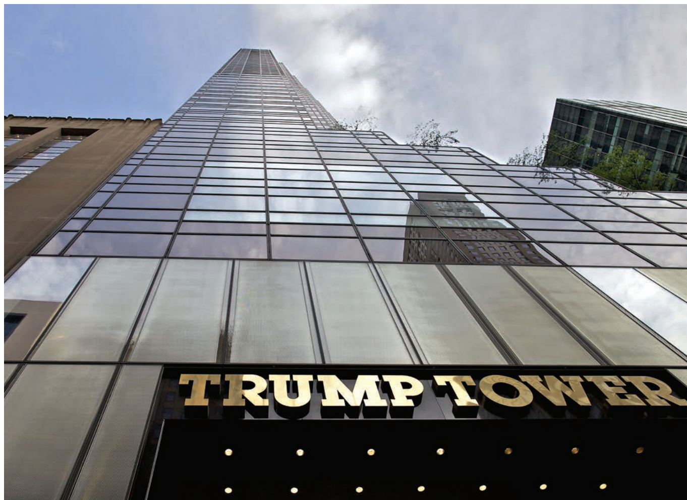
"Trump Tower".

Yet, the president's administration could simply refuse to provide budget support for