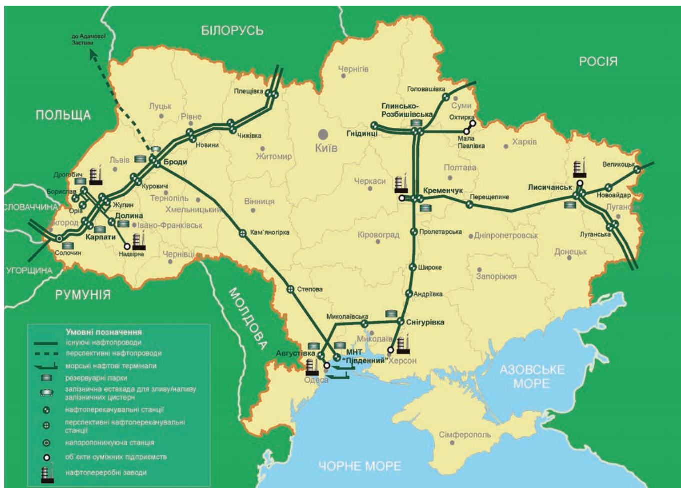
Система магистральных нефтепроводов Украины. www.ukrtransnafta.com