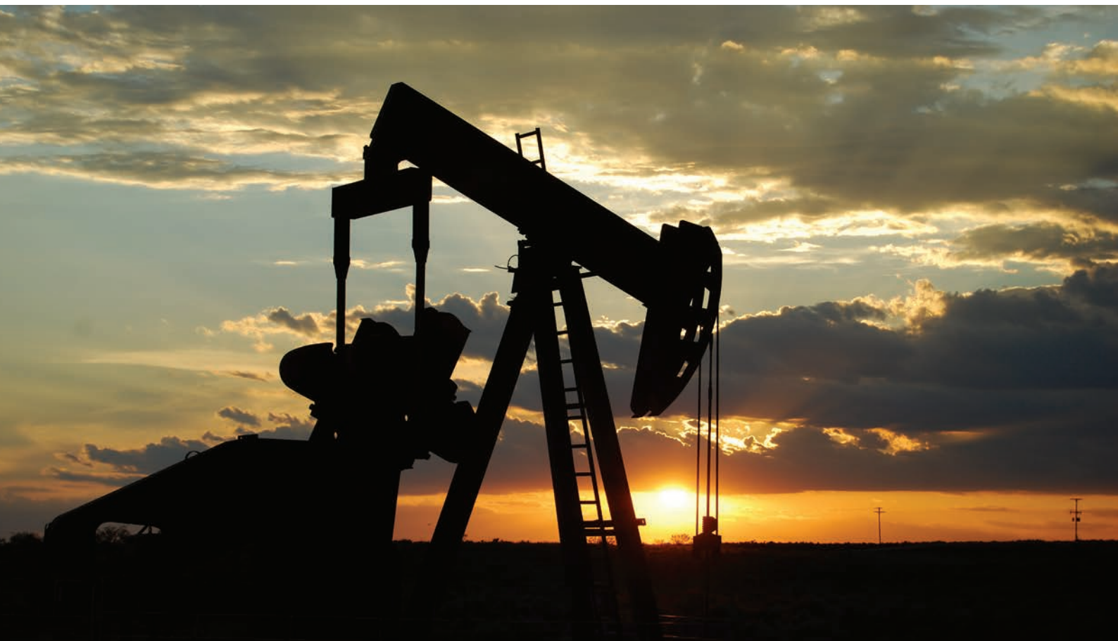
«Oil Pump Jack».