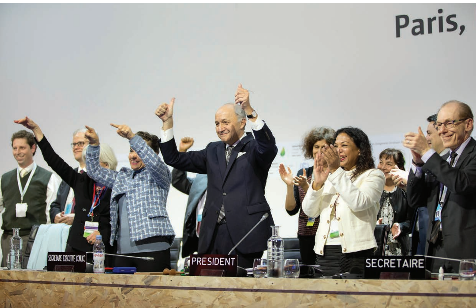
"Adoption of the Paris Agreement". Photo: UNclimatechange. Licensed under CC BY 2.0. FLICKR

It is interesting, how much Ukrainians are willing to pay for a dubious pleasure to follow the "global trend," especially considering the ques-