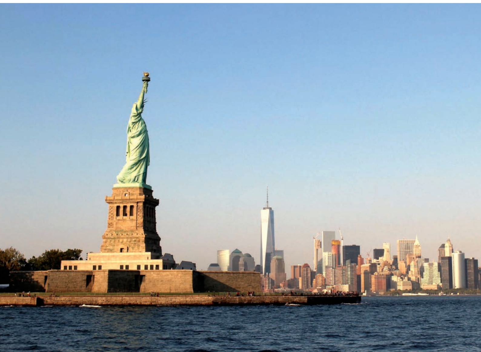
Фото: Bicad Media. Лицензия ССО. UNSPLASH