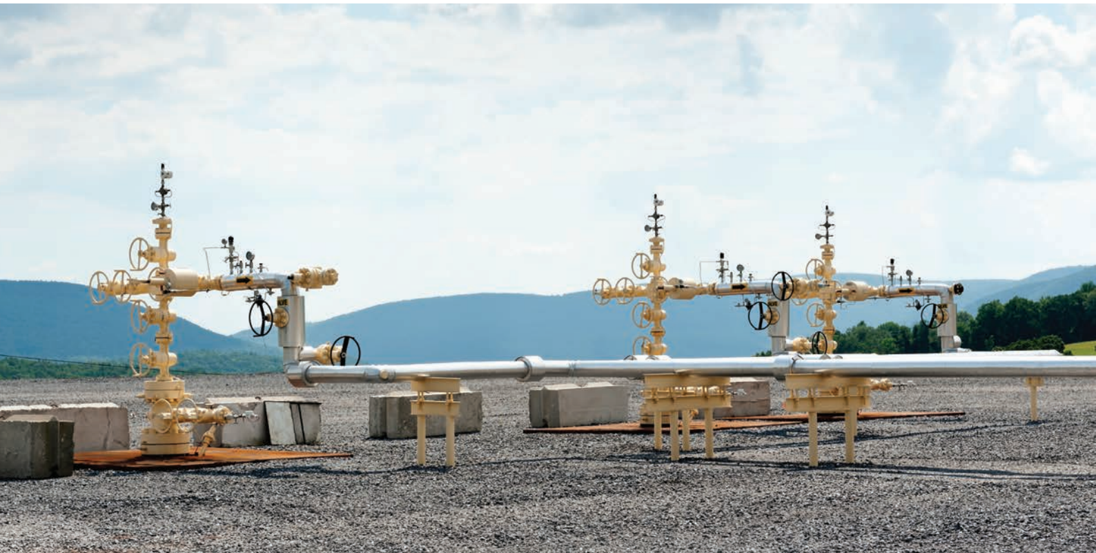
«Shale gas well 3». Фото: Jeremy Buckingham. Лицензия CC BY 2.0. FLICKR